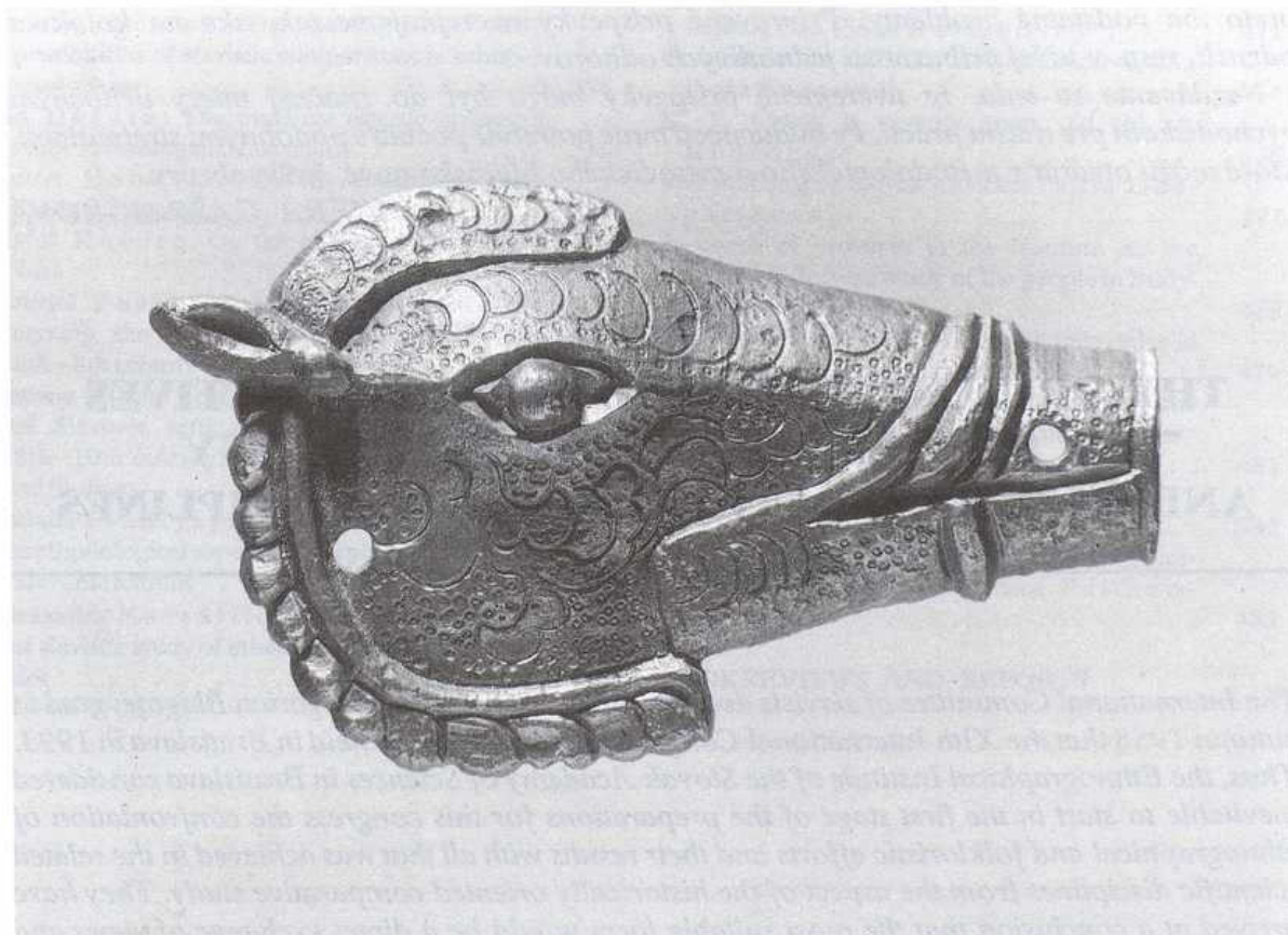
Bronzová hlava konika. Holiare.